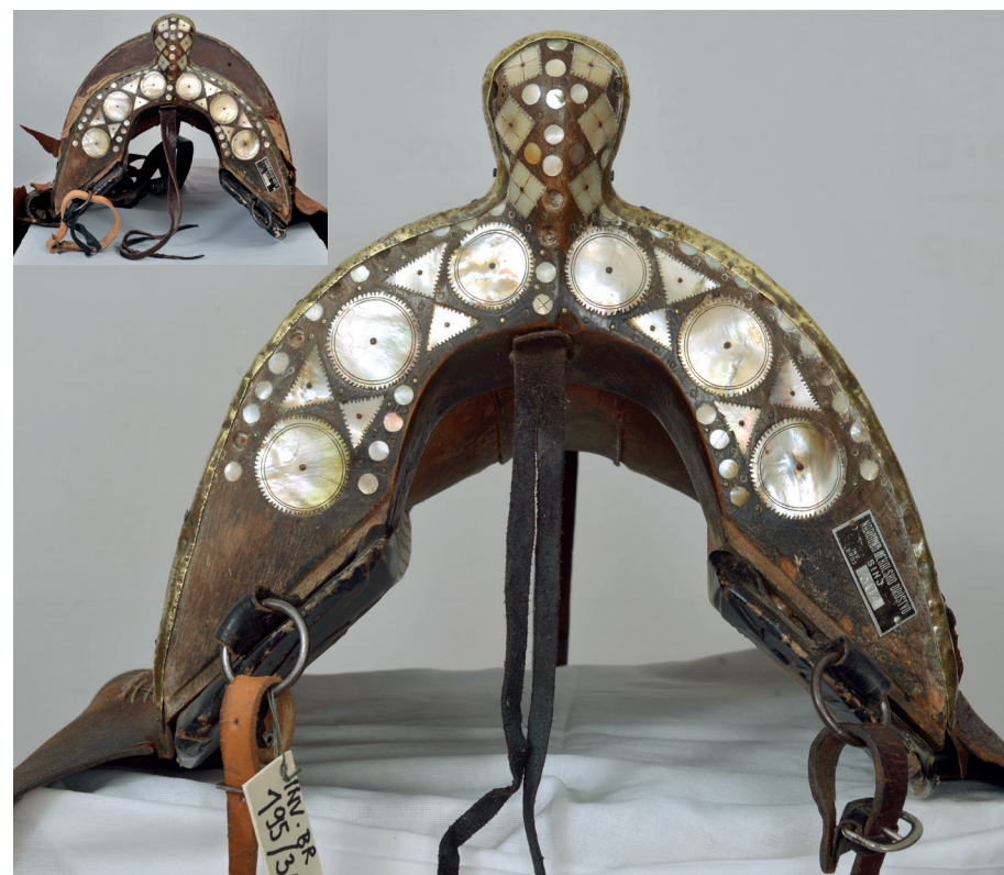
Sedlo za konja Edeka inv. br. 195 s inkrustacijama od sedefa prije i nakon radova s oštećenim kožnatim dijelovima i drvenom konstrukcijom