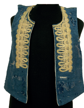
Stanje svilenog alkarskog krožeta inv. br. 273 prije i nakon radova. Tipična oštećenja nastala kontinuiranom upotrebom