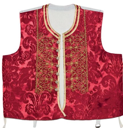
Replika krožeta inv. br. 286