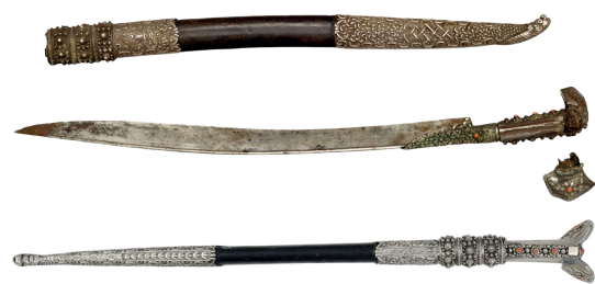
Jatagan inv. br. 82 sa srebrnim elementima i koraljima s patiniranim metalnim dijelovima i oštećenom drškom prije i nakon radova