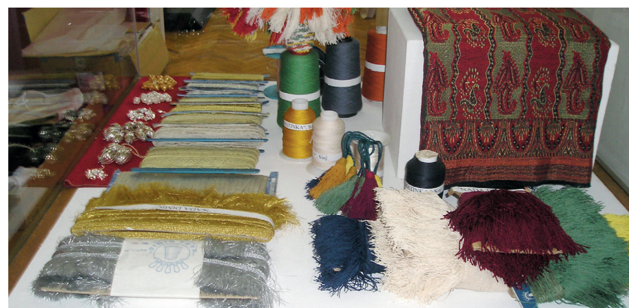
Raznovrsni materijal za izradu replika