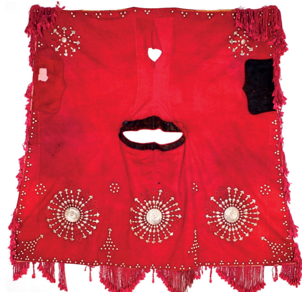
Abaja konja vojvode inv. br. 226 s kožnim i srebrnim ukrasima i svilenim resama prije i nakon radova