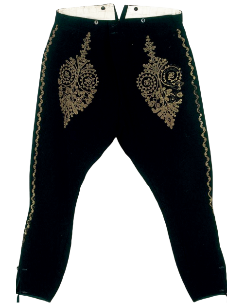
Gaće alkara inv. br. 324 nakon radova

desetaka djelatnika Hrvatskoga restauratorskog zavoda iz Odjela za tekstil, papir i kožu, Radionice za metal, Prirodoslovnog laboratorija i Informatičko-dokumentacijskog odjela Službe za pokretnu baštinu.